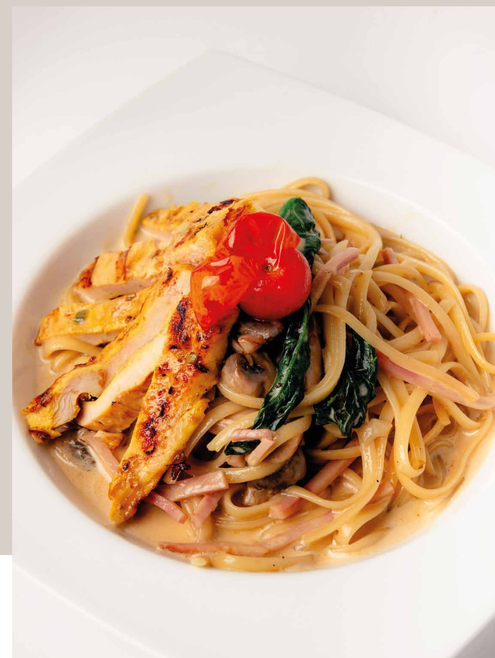
SPAGUETTI CON POLLO A LA PARRILLA

Incluye pan y queso parmesano. (Sin acompañamientos adicionales)