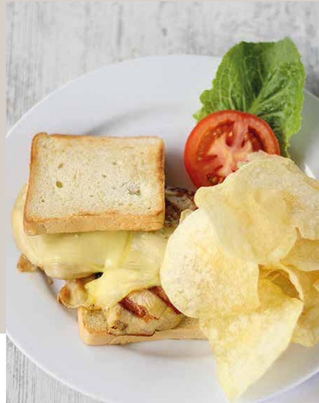
SÁNDWICH DE POLLO A LA PLANCHA JUNIOR Acompañado de papas chips (Pan Molde)