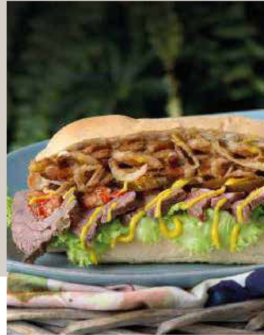
SÁNDWICH DE ROAST BEEF Con papas chips