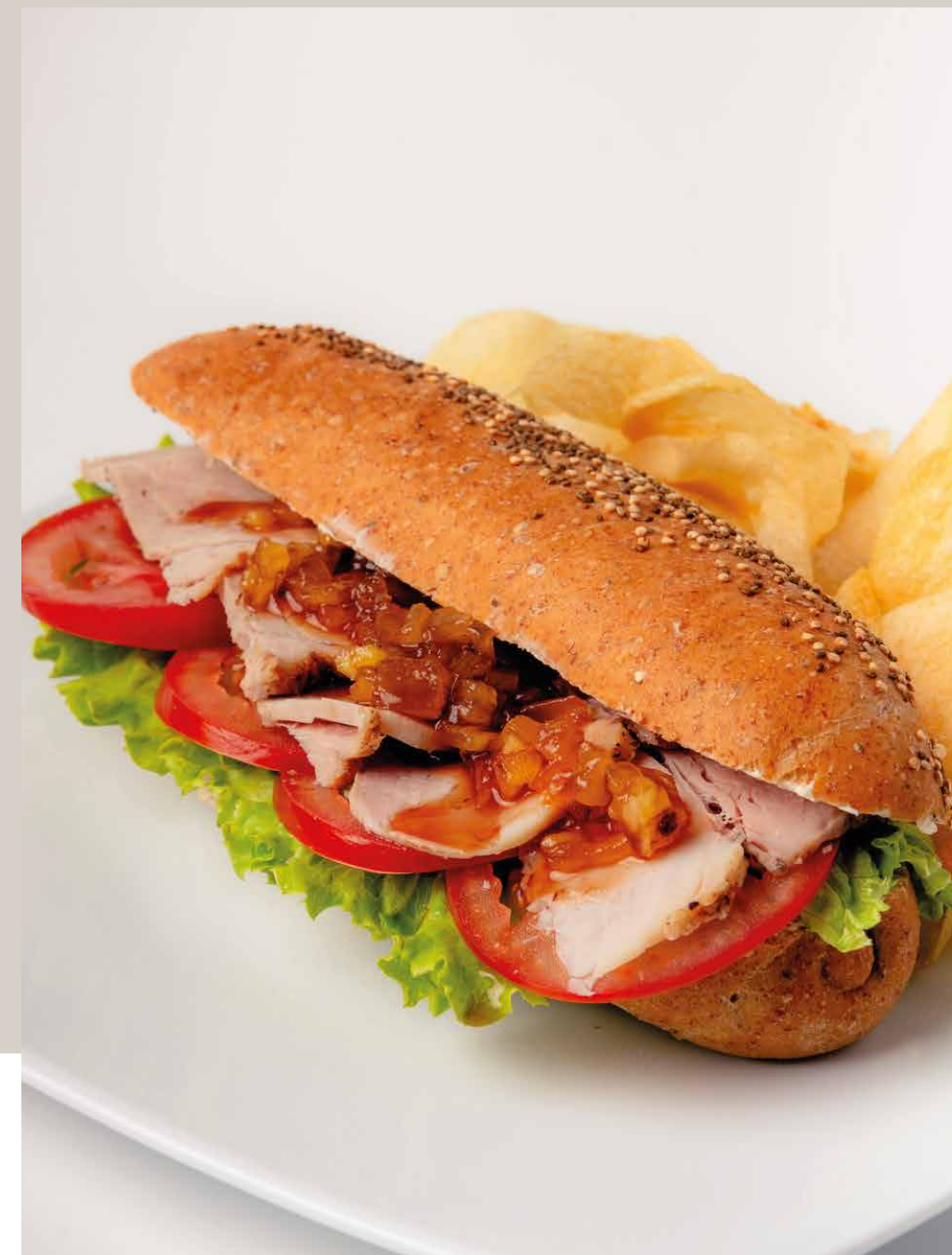
SANDWICH DE PERNIL DE CERDO EN PAN DE QUINUA