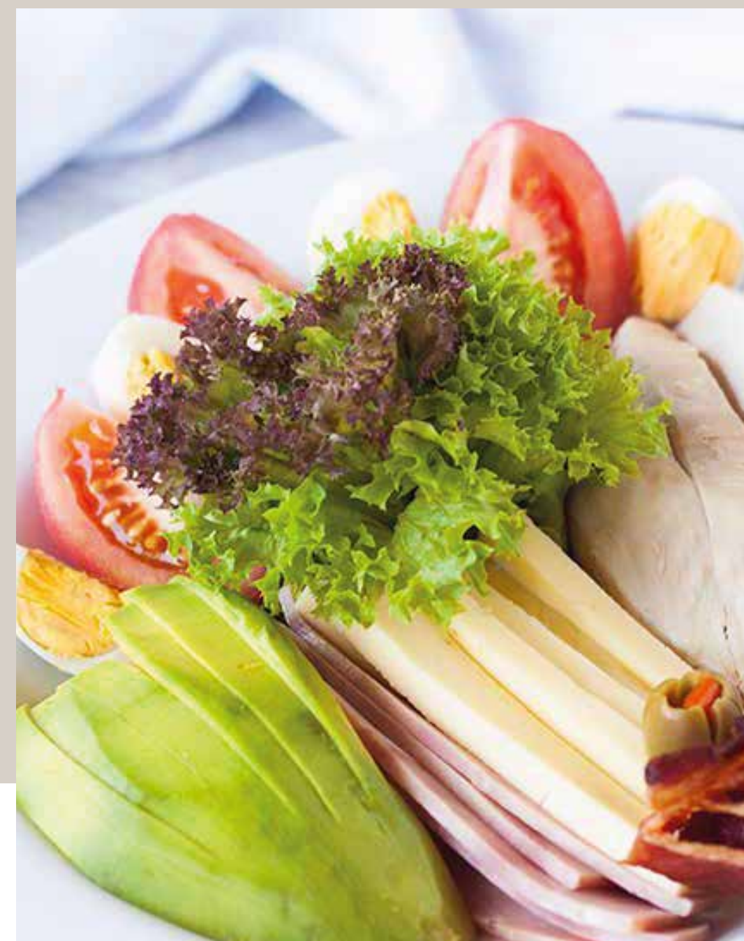
ENSALADA DEL CHEF