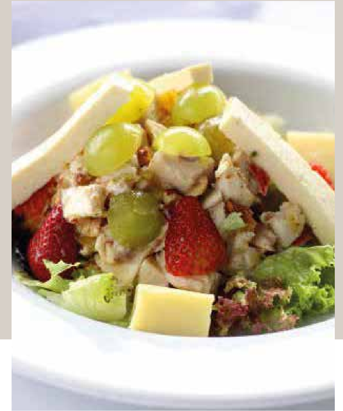
ENSALADA DE POLLO CON ALMENDRAS JUNIOR