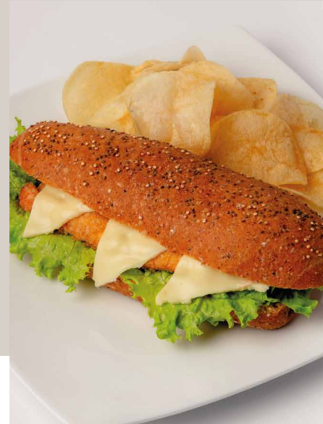
SANDWICH DE POLLO REBOSADO EN PAN DE QUINUA