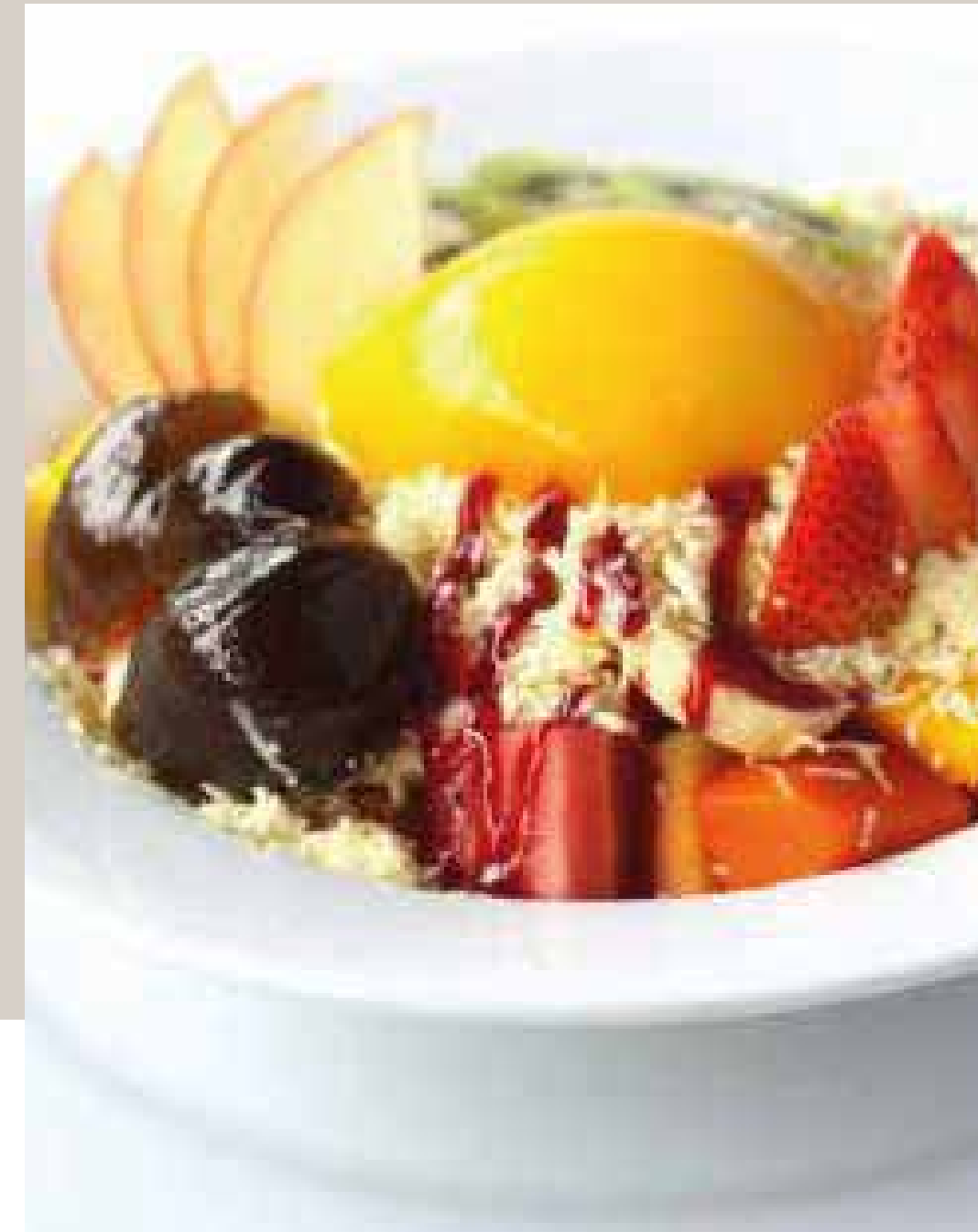
ENSALADA DE FRUTAS (Frutas seleccionadas: Papaya, mango, melón, patilla, fresa, banano, kiwi, durazno, manzana y brevas. Acompañada de queso rallado y crema de leche). No incluye bebida