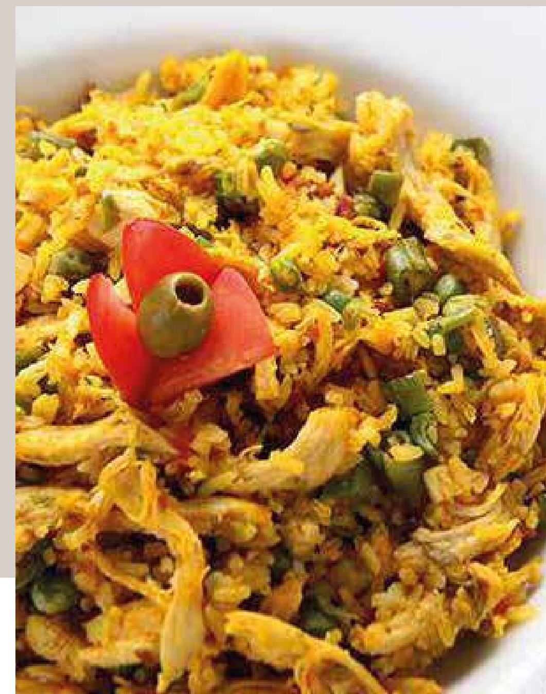
ARROZ CON POLLO JUNIOR