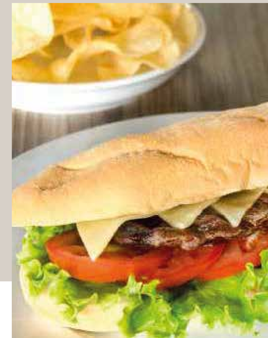
SÁNDWICH DE LOMO DE RES O DE CERDO