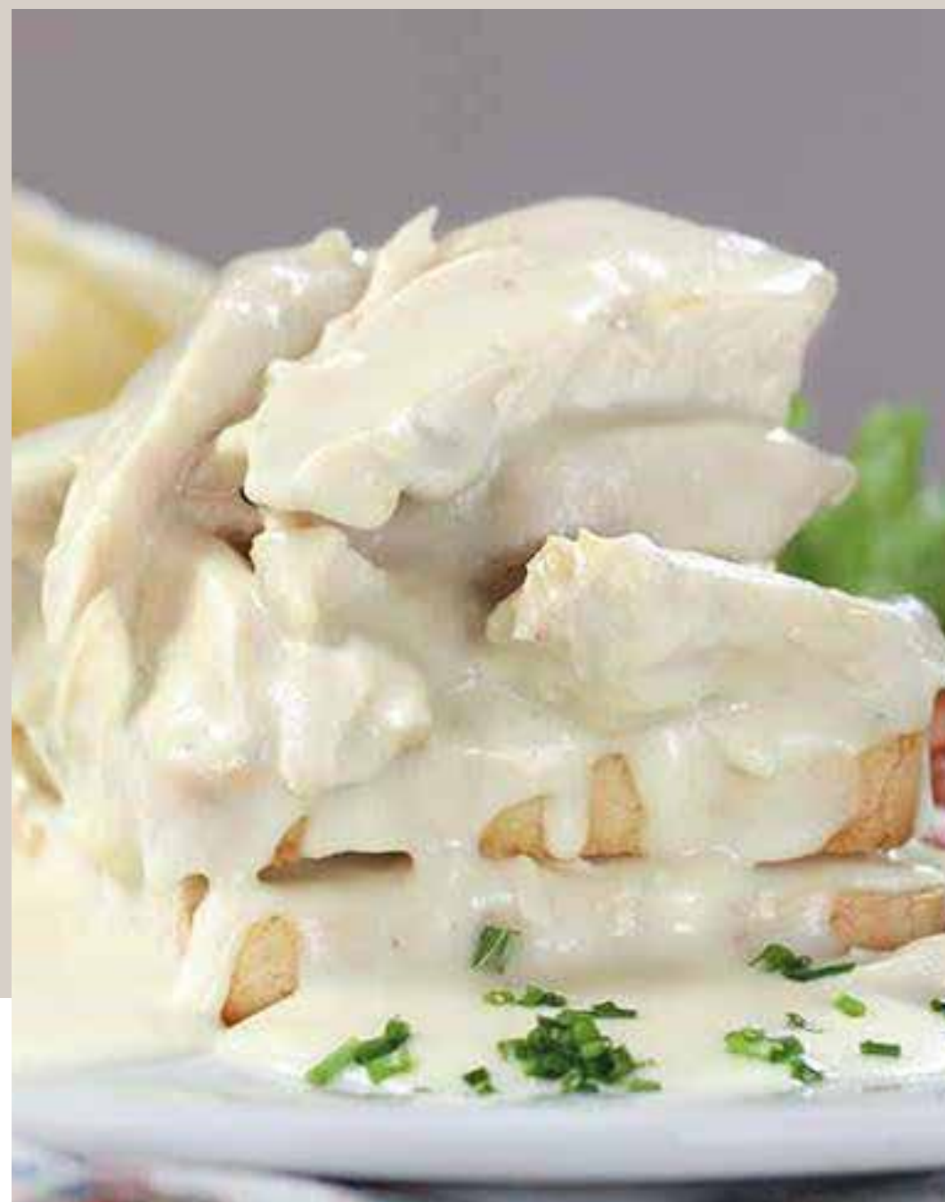
SÁNDWICH DE POLLO EN SALSA BECHAMEL Acompañado de papas chips