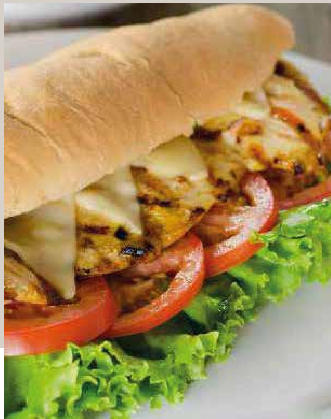
SÁNDWICH DE POLLO A LA PLANCHA Acompañado de papas chips