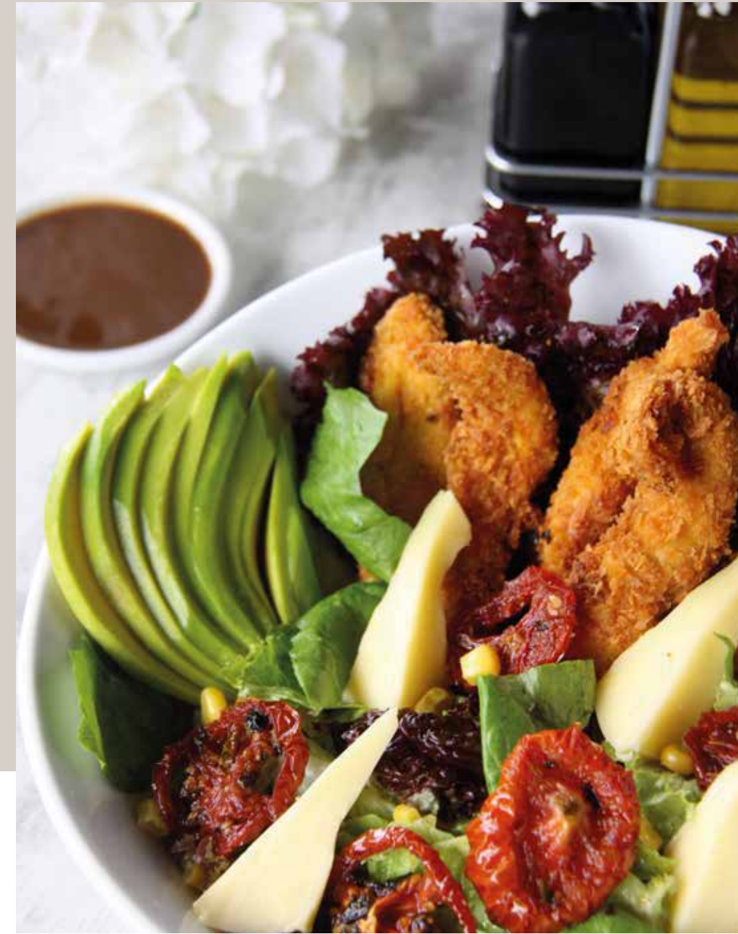
BOWL DE POLLO