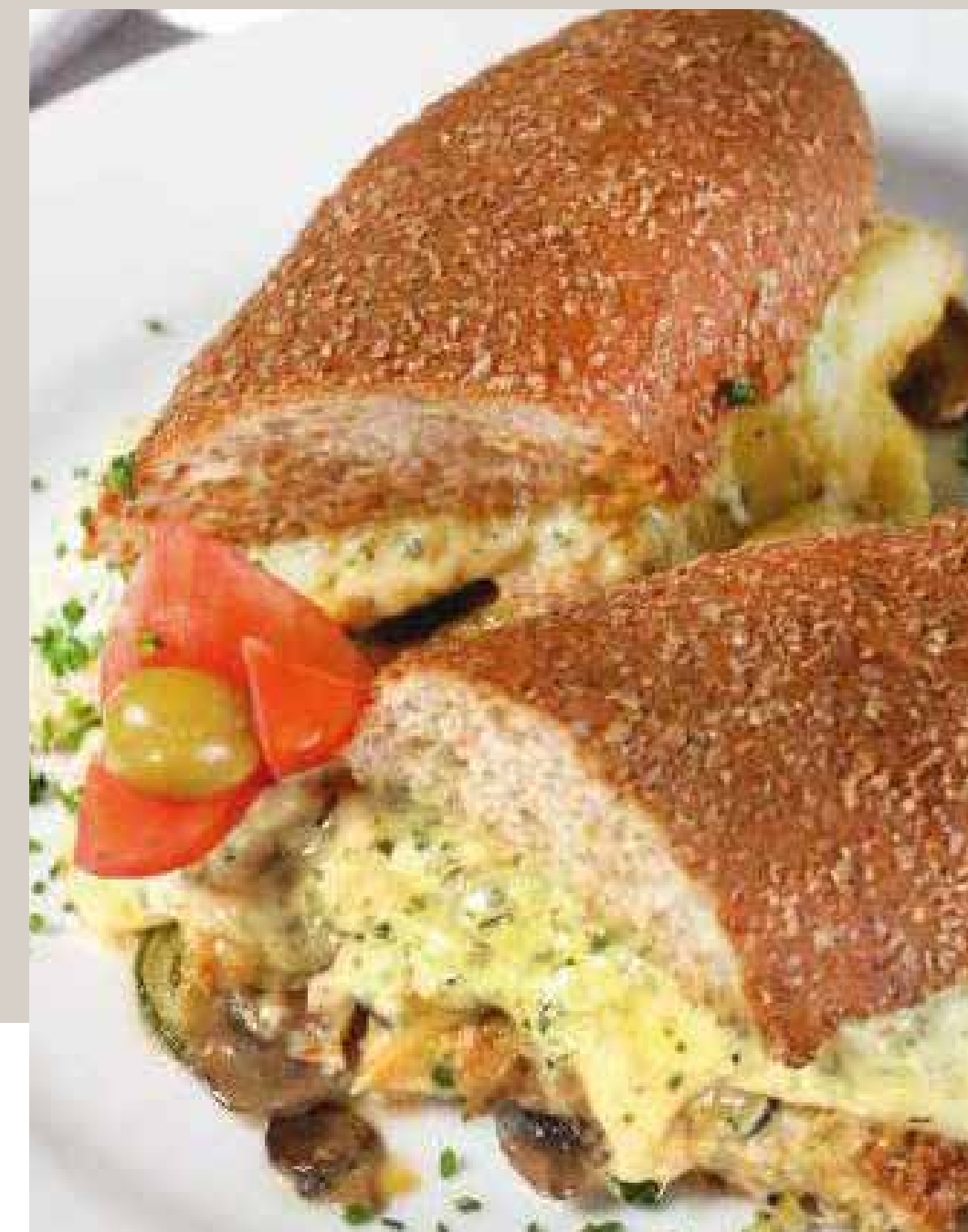
SÁNDWICH VEGETARIANO Acompañado de papa chips